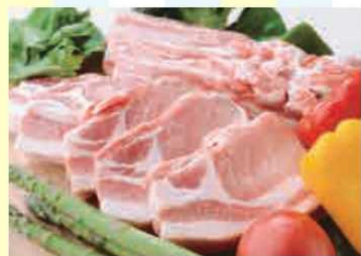
① 旨さが多彩チバポーク銘柄豚3種詰め合わせセット<6名様>

県内の直売所、農林漁業体験等の施設でお買い物や体験等をされた方を対象にプレゼントキャンペーンを開催中!!