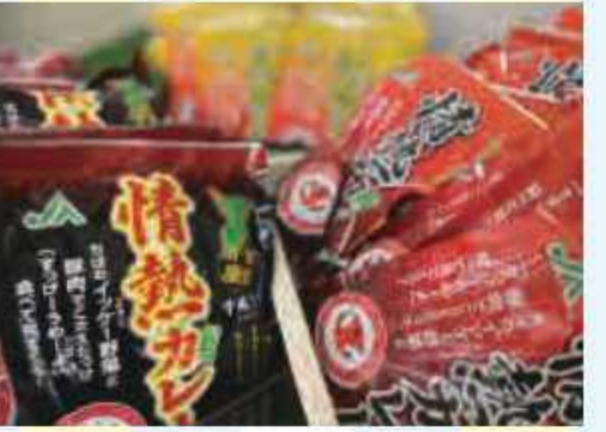
㉕ 精熱カレーセット(甘口2個 中辛2個 辛口1個)<10名様> 提供: JA富里市産直センター 2号店ひよし館