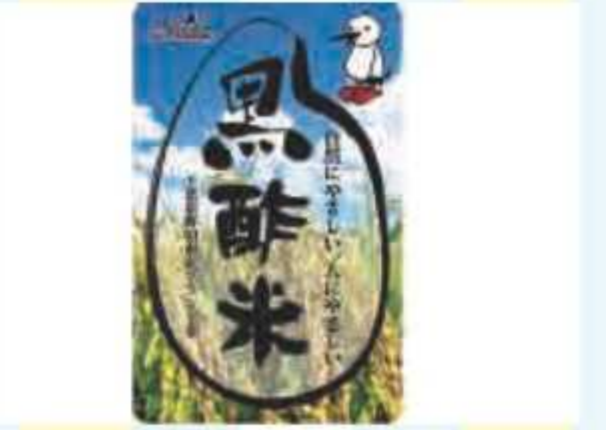
㊴ 黒酢米(3kg)<5名様> 提供: 農事法人 ゆめあくり野田