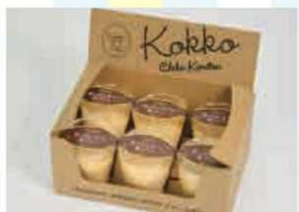
⑧ 菜の花たまごの舞プリン(6個)<3名様> 提供: 菜の花たまごの西野直売所Kokko