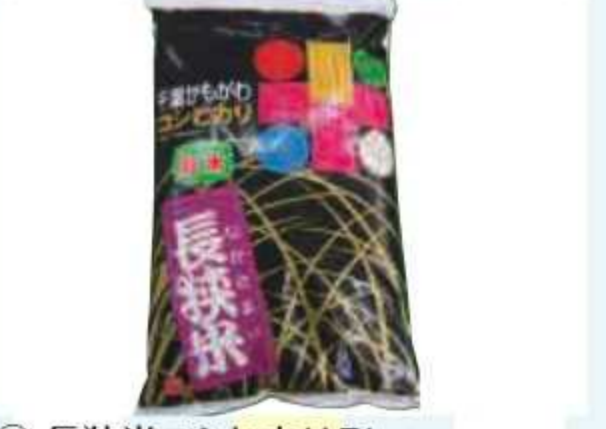
㉛ 長狭米コシヒカリ5kg<1名様> 提供: 安房農業協同組合 JAグリーン鴨川店