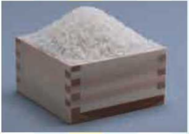
㊱ 木更津うまくと米5kg<1名様> 提供: JA木更津市生活館