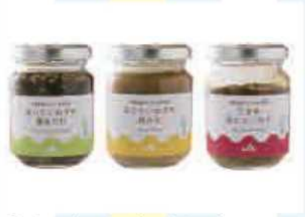
㉒ あじさいねぎのたれ3点セット<5名様> 提供: まつど農産物直売組合まつぼっくり