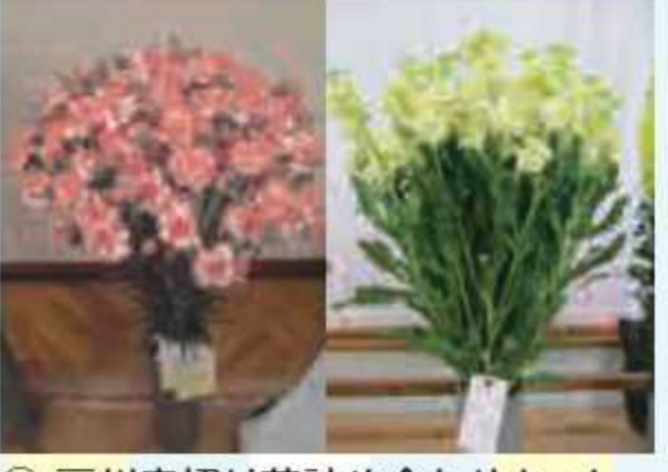
㉚ 房州産切り花詰め合わせセット<2名様> 提供: 安房農業協同組合 JAグリーン館山店