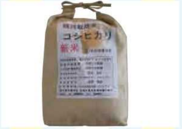
㊶ いすみ米コシヒカリ(2Kg)<6名様> 提供: 株式会社ごじゃ 箱岬店(3名様) 大原店(3名様)