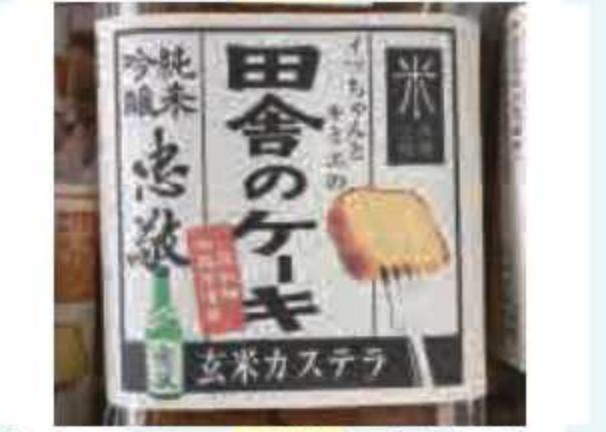
㉔ 田舎のケーキ(純米吟醸忠敬)<5名様> 提供: 道の駅水の郷さわら