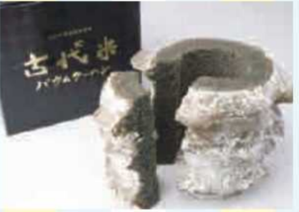
㊲ 古代米バウムクーヘン<10名様> 提供: 道の駅 風和里しばやま