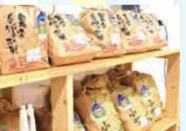
⑩ 坂下米3kg<3名様> 提供: ながら太陽ファーム[産直広場太陽]