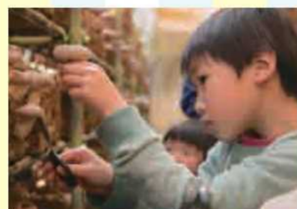
⑦ きのご狩り200g 無料券<5名様> 提供: 佐倉きのこ園