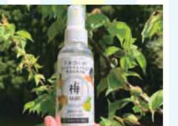
⑫ アルコールハンドケアローション 里のめく青100mlボトル<5名様> 提供: 群芳ファームゲストハウス/里のめく青