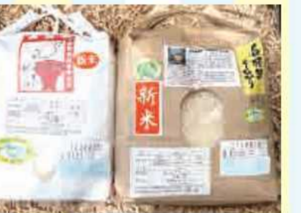
⑳ 鴨川産お米セット(2種)<2名様> 提供: 里のMUJIみんなみの里