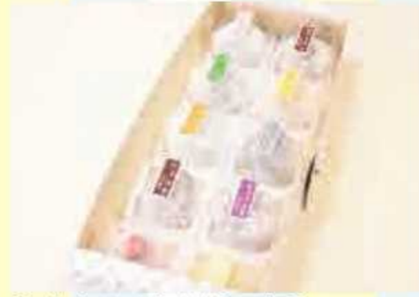
㉑ 生クリーム大福10個入<5名様> 提供: 道の駅富楽里とみやま