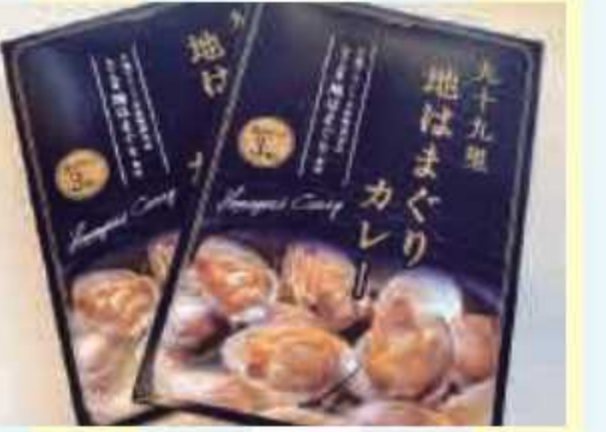
㉗ 九十九里 地はまぐりカレー<5名様> 提供: 海の駅九十九里