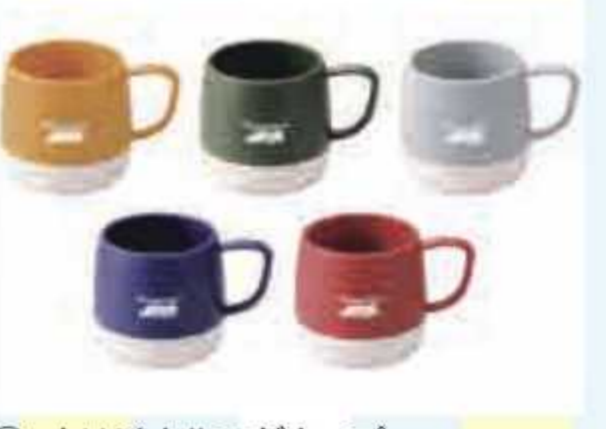
㉜ オリジナルマグカップ<5名様> 提供: 高滝湖グランピングリゾート