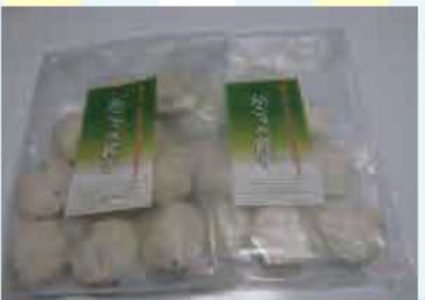
⑯ 葱ッペ餃子(1袋)<5名様> 提供: 農産物直売所 旬の里ねごぼうず