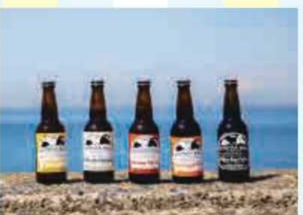
⑨ さよなんセット(定番5種)<1名様> 提供: 銘南麦酒