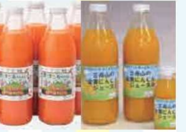
㉖ ニンジージュース350ml(4本)<5名様> 提供: JAきみつ味楽園さだもと店