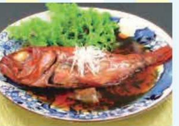
⑱ 銚子産金目鯛煮付け<5名様> 提供: 千葉県漁連海産物直売所[海市場]