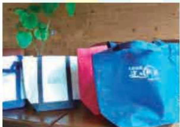
⑮ 保冷トートバッグ<5名様> 提供: 道の駅 みのりの郷東金