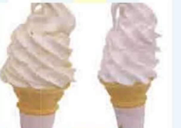
⑲ たまごソフト、ミルクソフト引換券(各1枚ずつ)<10名様> 提供: 九十九里ファーム たまご屋さん Cocco