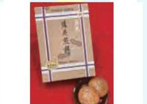
⑰ 落花煎餅<5名様> 提供: そうさ観光物産センター 匝りの里