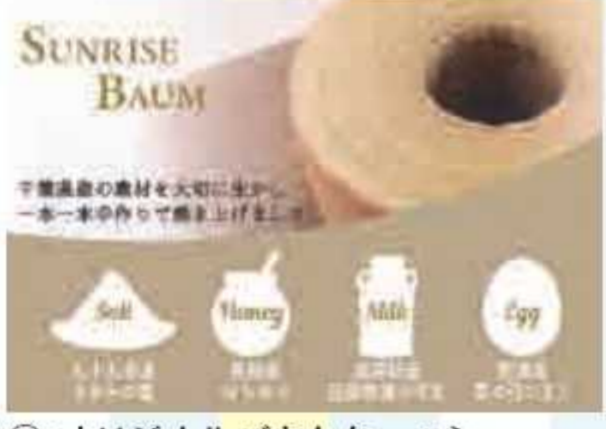
㉙ オリジナルバウムクーヘン<5名様> 提供: 国民宿舎サンライズ九十九里