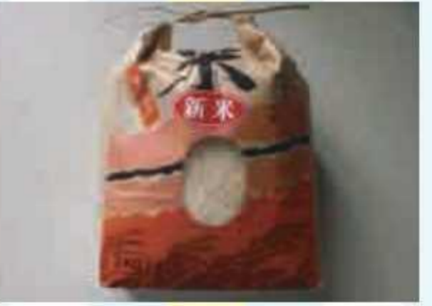
㊳ 白米(コシヒカリ)3kg<5名様> 提供: しもだ農産物直売所