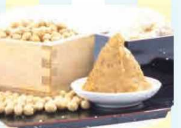
⑪ ながら味噌<3名様> 提供: ながら太陽ファーム[産直広場太陽]