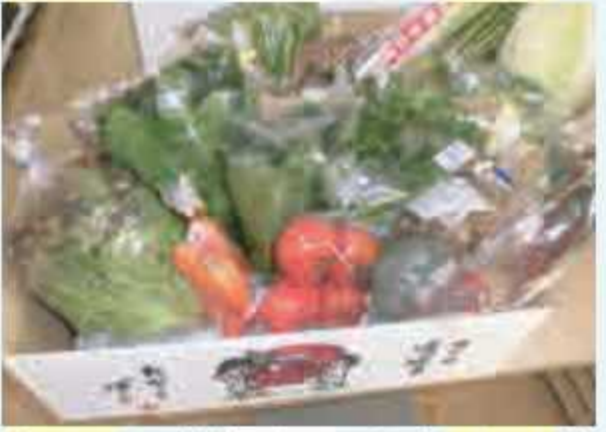
㉓ オライの宝箱(やさしい詰め合わせセット)<3名様> 提供: 道の駅 オライはすぬま