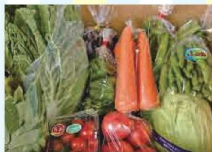
③ ちばエコ農産物の詰め合わせ<10名様>