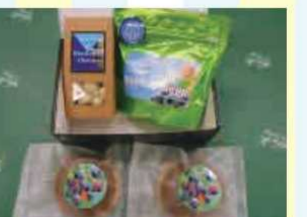
⑬ 空の駅 風和里しばやま オリジナルギフト<5名様> 提供: 空の駅 風和里しばやま