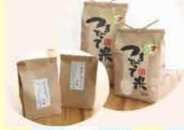
㉘ 千葉エコ米 千葉県産令和4年度産コシヒカリ(2kg)<5名様> 提供: マルシェ かしま