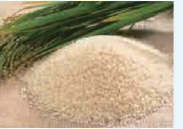
㊵ いすみ産コシヒカリ(3kg)<5名様> 提供: 農産物直売所なのはな