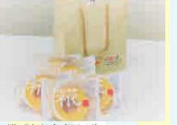
㉞ 糰はあむ(5個入り)<5名様> 提供: 道の駅 発酵の里こうざき