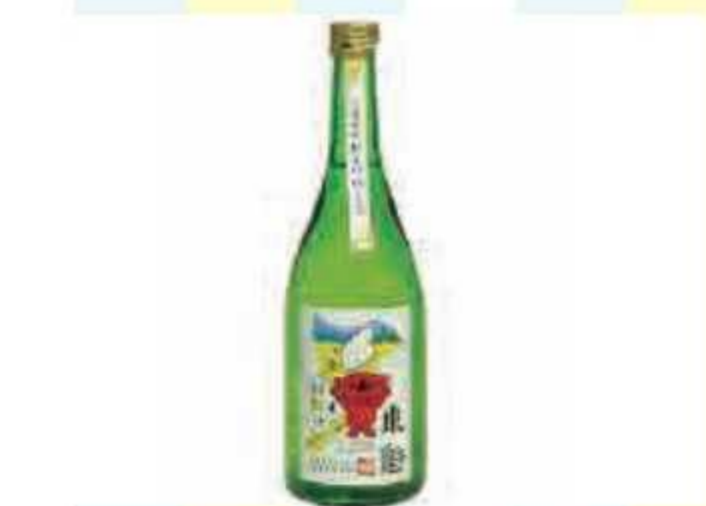
⑥ 食のちばの逸品 銅賞 純米吟醸 東魁 粒すけ720ml<10名様>