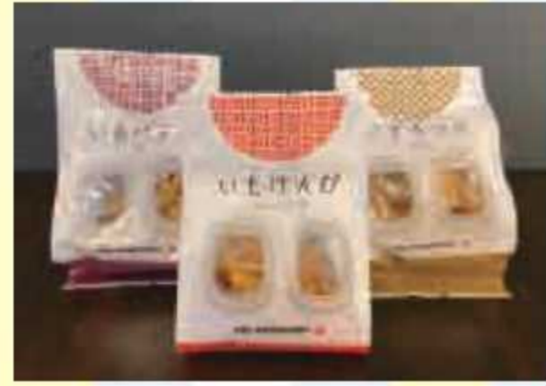
㉟ いもけんぴ、いもちっふ3種類セット(化粧箱入り)<5名様> 提供: DINING PORT 御料鶴