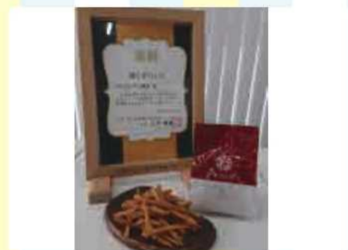
④ 食のちばの逸品 金賞 寝た芋けんぴ(詰め合わせ)<10名様>