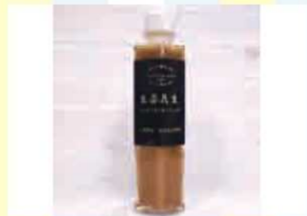
⑭ オリジナルオイルドレッシングギフトセット(3本セット)<10名様> 提供: 道の駅 みのりの郷東金