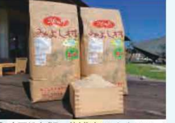
㉝ 南房総市(旧三芳村)産コシヒカリ(5kg)<3名様> 提供: 農産物直売所 土のめくみ館