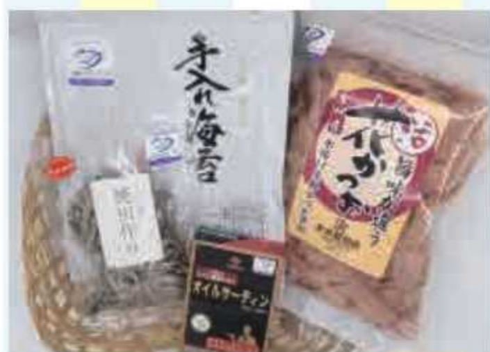
② 千葉ブランド水産物の詰め合わせ<10名様>